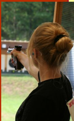
Du tir de précision...

Les fondamentaux de la technique de tir à l'arme de poing sont enseignés dans ce cours élémentaire. Ce dernier servira de base pour votre propre formation et pour la fréquentation des autres cours de l'ESTP. Sans être indispensable, au préalable, de bonnes notions de tir permettront aux participants de mieux assimiler les connaissances acquises.