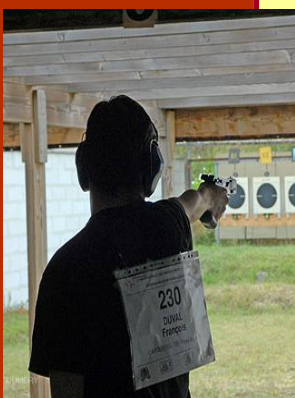
... A la découverte du tir de vitesse