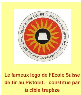
Le fameux logo de l'Ecole Suisse de tir au Pistolet, constitué par la cible trapèze

Depuis 2004, suite de dissensions avec la FST, l'ESTP s'est constituée en association privée, regroupant quelques 300 membres actifs.